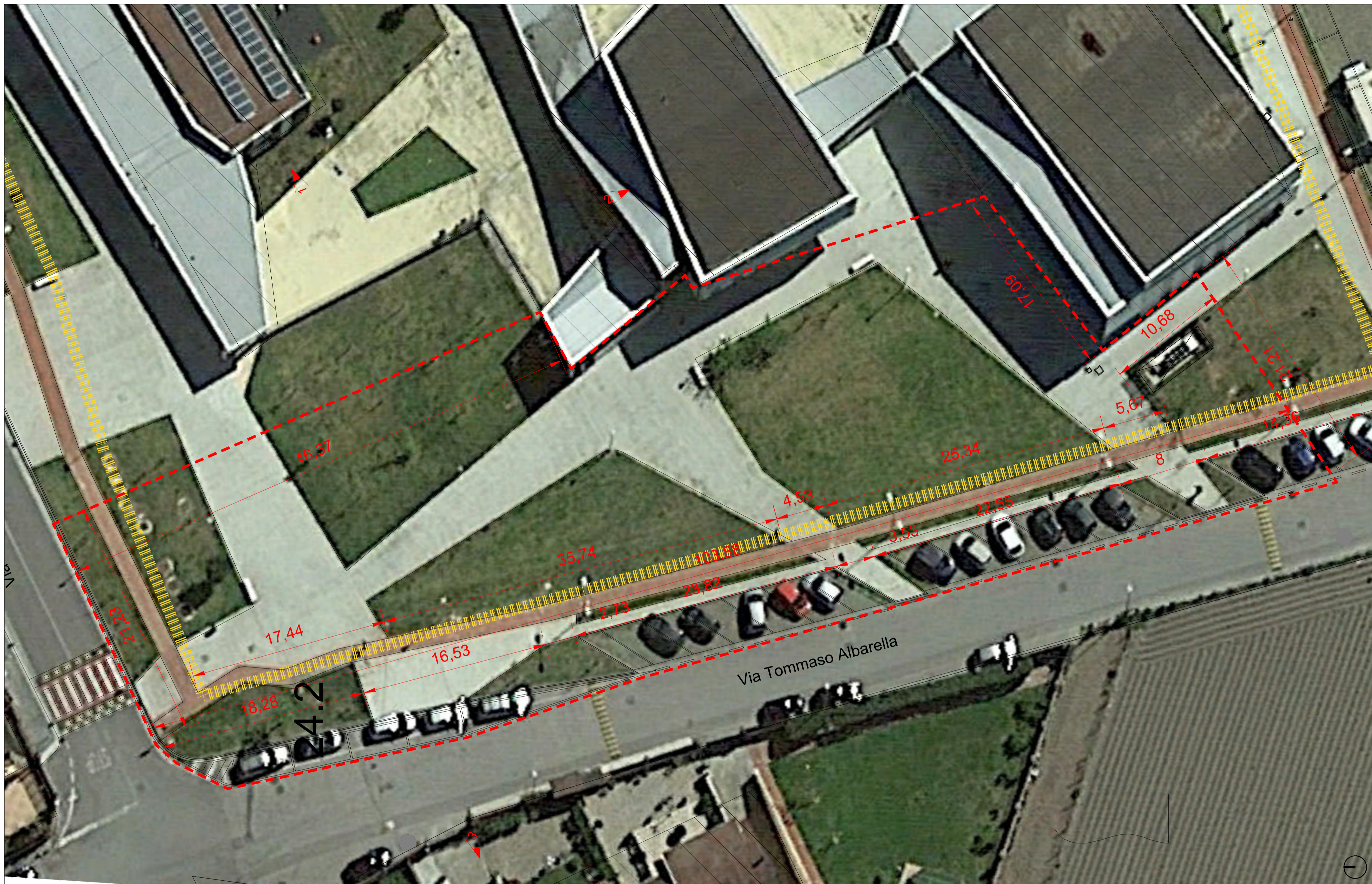
Ortofoto- stato di fatto - scala 1:200